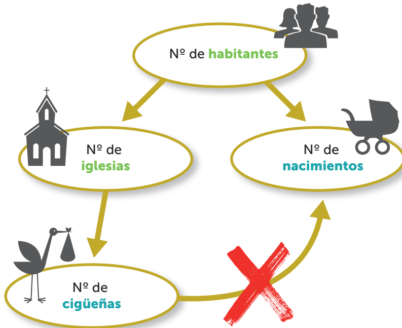
Figura 2. Grafo dirigido acíclico de causalidad del número de nacimientos. Adaptada de Díez Vegas, 2005 2 .

la probabilidad de que se presente la enfermedad. Sin embargo, un factor pronóstico de una enfermedad es un factor cuya presencia o ausencia indica peor o mejor evolución de la enfermedad. Los factores pronósticos pueden ser explicativos : cuando su presencia produce un cambio en el pronóstico (relación causal); y predictivos : cuando la presencia del factor solo indica un cambio en el pronóstico (relación no causal) 6 .